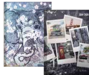
50020256 Legend 1 A5 Tag gebunden