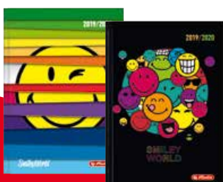
50020300 SmileyWorld A6 Tag gebunden