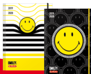
50020317 Smiley A5 Woche gebunden