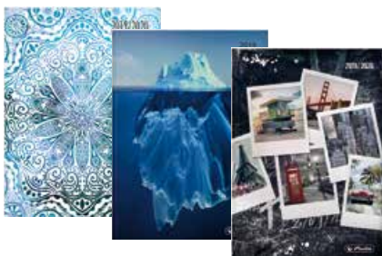
50020270 UpToDate A6+ Woche gebunden