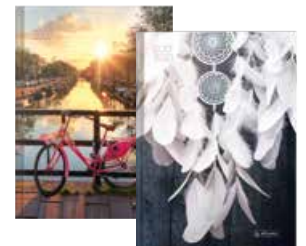
50020263 Legend 2 A5 Tag gebunden