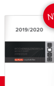
50022625 Ersatzkalendarium Flex A5