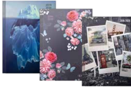
50020201 Basic 2 A5 Woche gebunden