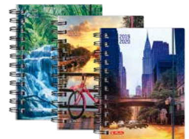
50020294 Fun A6 Tag Spirale