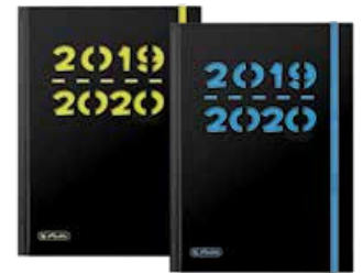
50020249 Pure A5 Woche gebunden