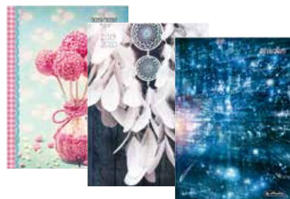
50020287 Season A6 Tag gebunden