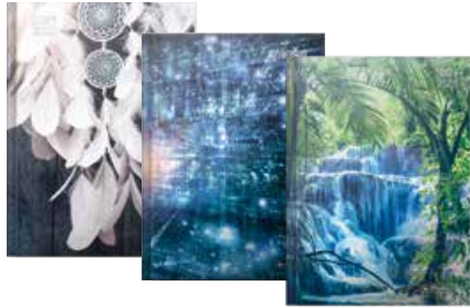
50020195 Basic 1 A5 Woche gebunden