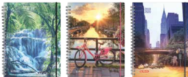
50020218 MustHave 1 A5 Woche Spirale