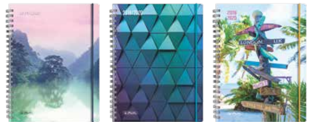
50020225 MustHave 2 A5 Woche Spirale