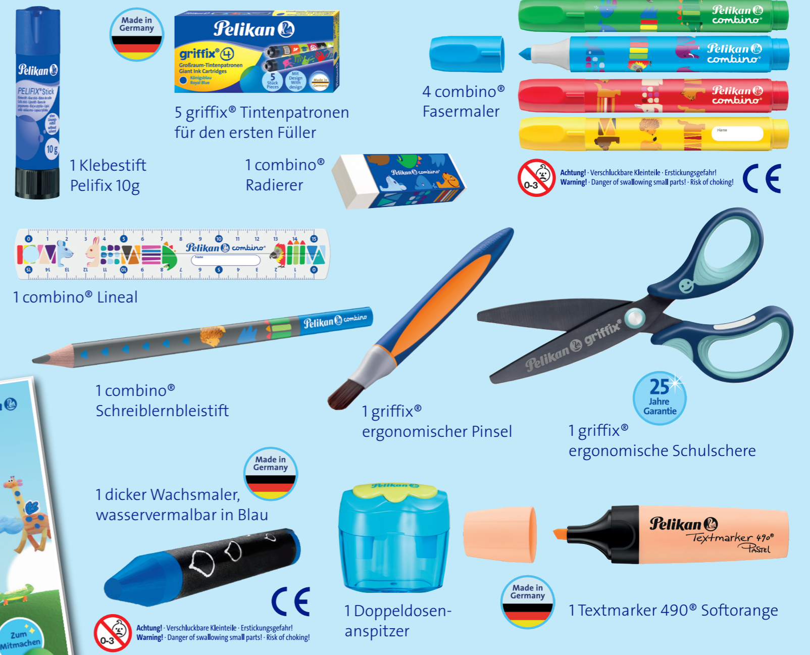
1 Klebestift Pelifix 10g