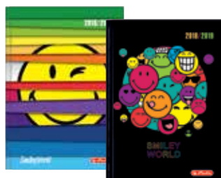
50015665 SmileyWorld A6 Tag gebunden