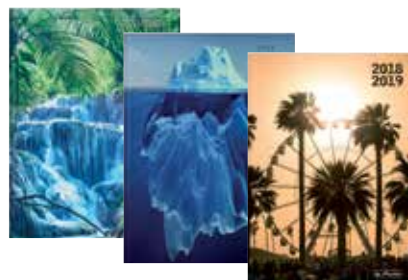
50015641 Season A6 Tag gebunden