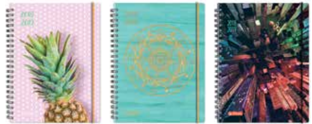
50015580 MustHave 2 A5 Woche Spirale