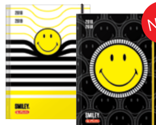
50015672 Smiley A5 Woche gebunden