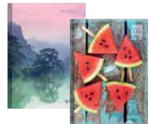
50015627 Legend 2 A5 Tag gebunden