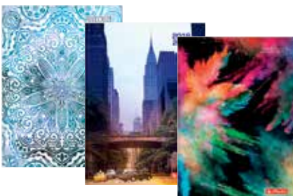
50015634 UpToDate A6+ Woche gebunden