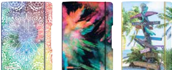
50015597 Flex A5 Woche plus Notizheft