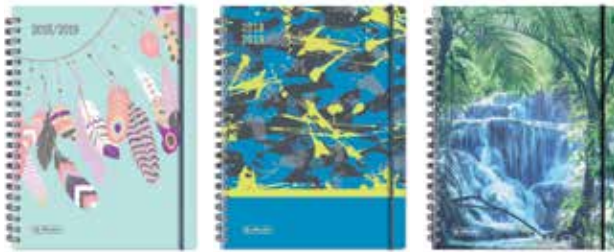
50015573 MustHave 1 A5 Woche Spirale