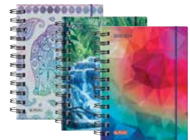
50015658 Fun A6 Tag Spirale