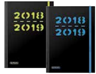
50015603 Pure A5 Woche gebunden