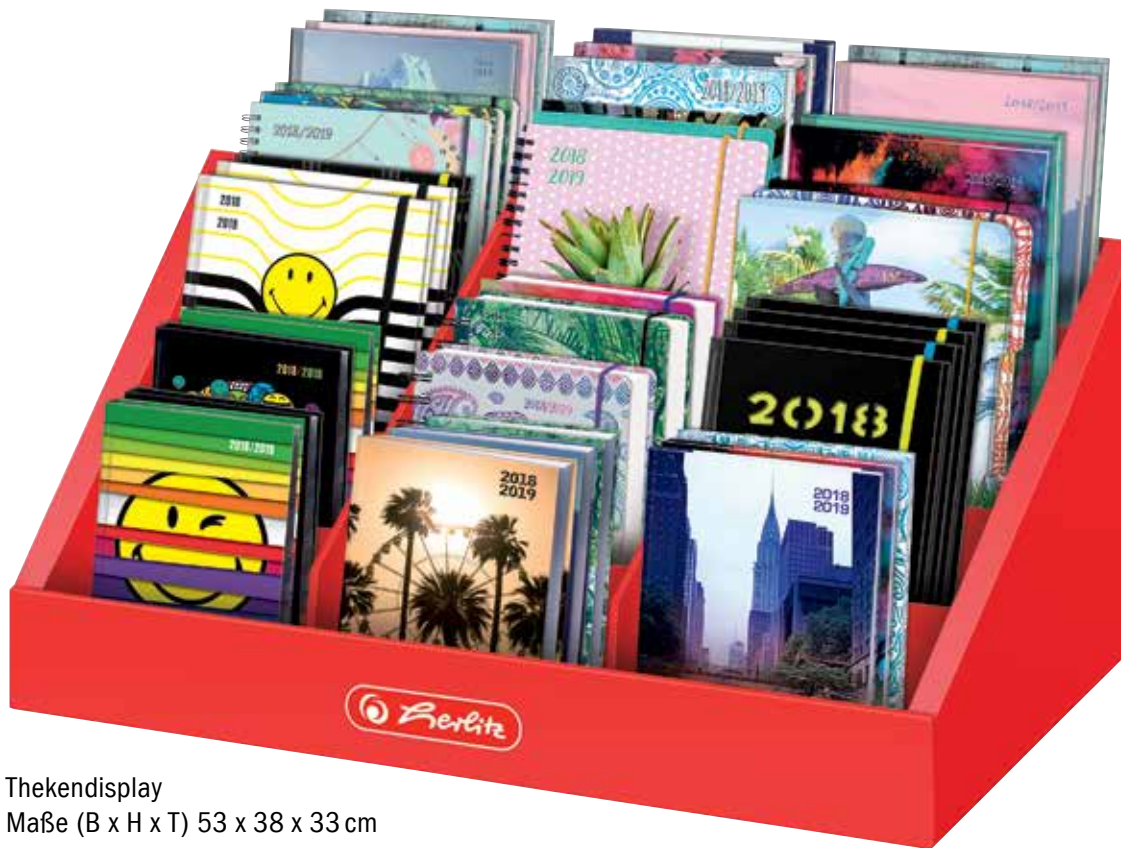
Thekendisplay Maße (B x H x T) 53 x 38 x 33 cm