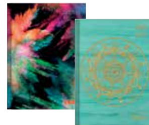
50015610 Legend 1 A5 Tag gebunden